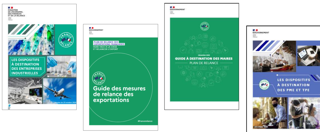
Couverture des 4 guides spécifiques ( www.planderelance.gouv.fr )